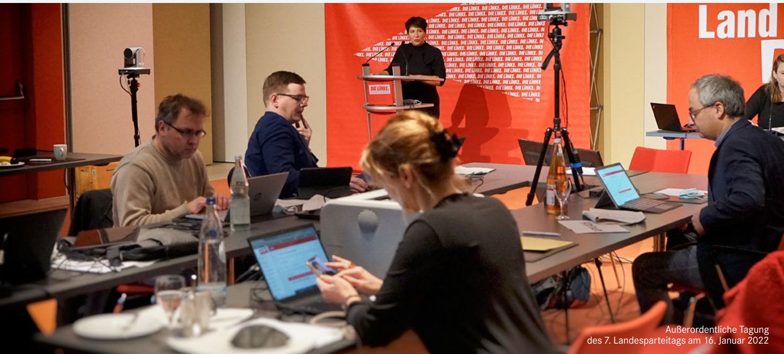
Außerordentliche Tagung des 7. Landesparteitags am 16. Januar 2022