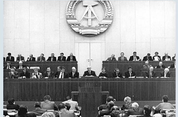
11. Tagung der Volkskammer am 13. November 1989

Anstelle des zurückgetretenen Horst Sindermann (SED) wird nun Günter Maleuda (DBD) zum Präsidenten der Volkskammer gewählt. Hans Modrow (SED) wird zum Ministerpräsidenten der DDR gewählt. Ein Antrag der CDU-Fraktion, die führende Rolle der SED aus der Verfassung zu streichen, wird noch in Vorbereitung der Tagung abgeblockt.