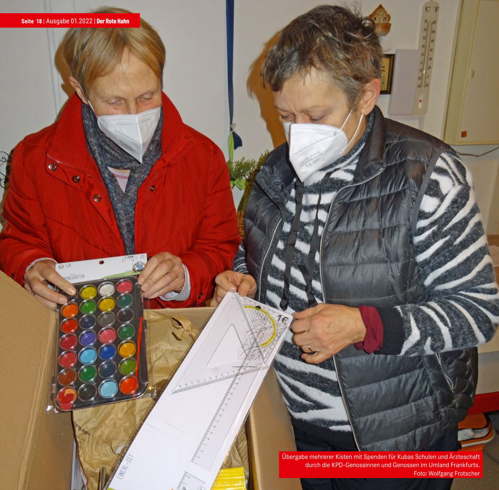
Übergabe mehrerer Kisten mit Spenden für Kubas Schulen und Ärzteschaft durch die KPD-Genossinnen und Genossen im Umland Frankfurts.