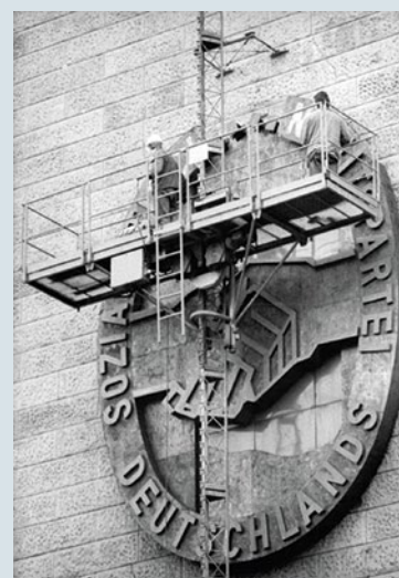
SED-Symbol am ehemaligen Gebäude des Zentralkomitees am Werderschen Markt in Berlin

„Genossen, ich bitte um Verständnis. Ich weiß nicht, ob wir alle oder ob viele den Ernst der Lage erkannt haben. Der Druck, der bis gestern auf die tschechoslowakische Grenze gerichtet war, ist heute Nacht auf unsere Grenzen gerichtet. Es besteht eine große Gefahr, dass uns viele Menschen verlassen. Obwohl, ein positives Zeichen ist, von denen, die heute Nacht nach Westberlin gegangen sind, der Druck war nicht zu halten, es hätte nur eine militärische Lösung gegeben, Genossen, damit wir uns einig sind, durch das besondere Verhalten unserer Grenzsoldaten, unserer Genossen vom Mdl, vom MfS ist die Sache mit großer Ruhe bewältigt worden und über zwei Drittel derer, die heute Nacht Westberlin besucht haben, sind inzwischen wieder auf ihren Arbeitsplätzen hier. Das ist ein positives Signal. Aber der Druck nimmt weiter zu.“ (Quelle: Protokoll der 10. Tagung des ZK der SED, S. 121).