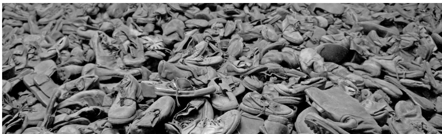
Tausende Schuhe von Opfern der industriellen Vernichtung im Konzentrationslager "Auschwitz I" im Staatlichen Museum Auschwitz-Birkenau

Von all den Zeugen, die geladen, vergess ich auch die Zeugen nicht. Als sie in Reihn den Saal betraten, erhob sich schweigend das Gericht.