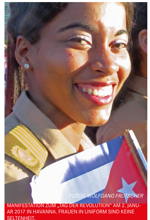
MANIFESTATION ZUM „TAG DER REVOLUTION“ AM 2. JANUAR 2017 IN HAVANNA. FRAUEN IN UNIFORM SIND KEINE SELTENHEIT.