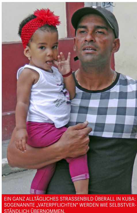
EIN GANZ ALLTÄGLICHES STRASSENBILD ÜBERALL IN KUBA: SOGENANNT „VATERPFLICHTEN“ WERDEN WIE SELBSTVERSTÄNDLICH ÜBERNOMMEN.