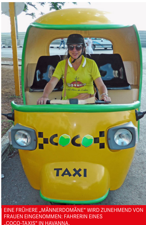
EINE FRÜHERE „MÄNNERDOMÄNE“ WIRD ZUNEHMEND VON FRAUEN EINGENOMMEN: FAHRERIN EINES „COCO-TAXIS“ IN HAVANNA.