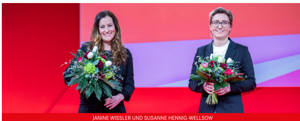
JANINE WISSLER UND SUSANNE HENNING-WELLSOW