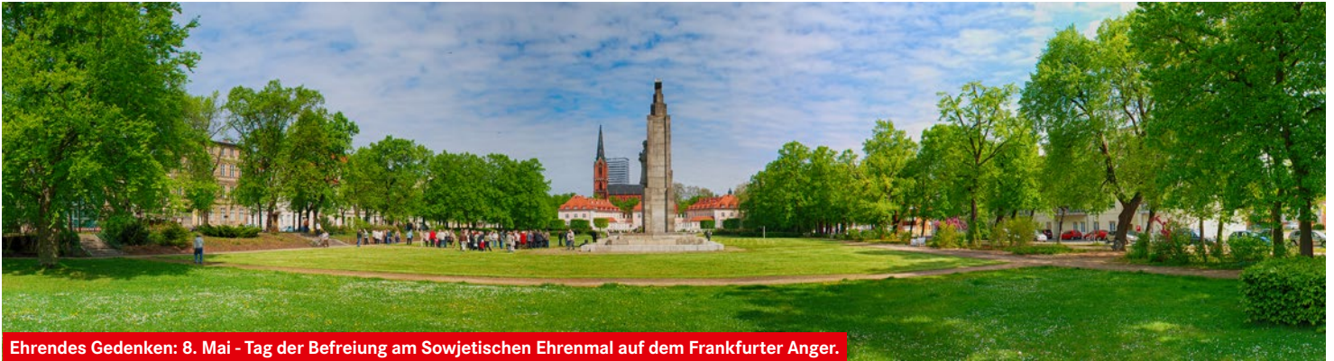
Ehrendes Gedenken: 8. Mai - Tag der Befreiung am Sowjetischen Ehrenmal auf dem Frankfurter Anger.

Um es vorwegzunehmen: Die in diesem Artikel erwähnten Veranstaltungen sind eine tolle Bereicherung für unsere Stadt und Region. Sie sollten und müssen im nächsten Jahr wieder durchgeführt werden. Bei der Organisation dieser Termine sollte man auf städtischer Seite aber unbedingt einen wichtigen Aspekt bedenken, auf den ich in den nachfolgenden Zeilen näher eingehen will.