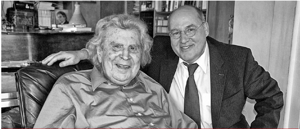
Mikis Theodorakis und Gregor Gysi in Athen (2012)

Der Komponist, Schriftsteller und Politiker Mikis Theodorakis, Volksheld Griechenlands und Internationalist ist am 2. September im Alter von 96 Jahren verstorben.