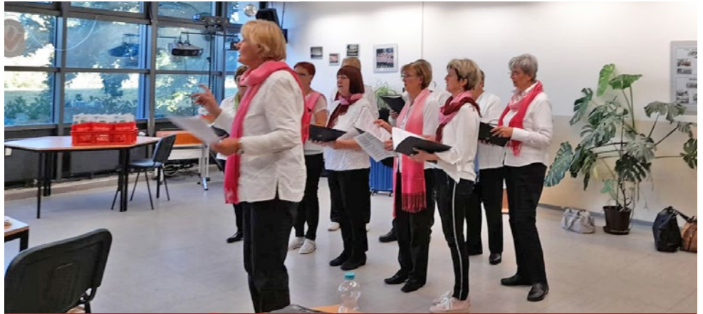
Auftritt des Seniorenchores „Lebensfreude“

Eine schöne Tradition wurde mit der Ehrung der langjährigen Mitgliedschaft zwischen 50 bis 75 Jahre unserer Genossinnen und Genossen durch die AG Senioren am 08.10.2021 fortgesetzt.